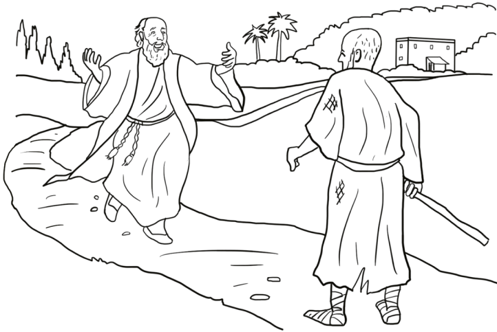
Collwyd y mab ac yna cafwyd hyd iddo.

Cwblha weddill yr olygfa i ddangos beth wnaeth y tad i groesawu ei fab adref.