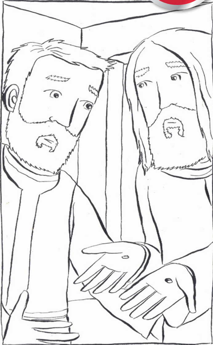
Iesu'n dweud wrth Tomos, 'Stopia amau! Creda!'